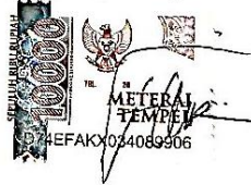
FITRI NUR KHOLIFAH