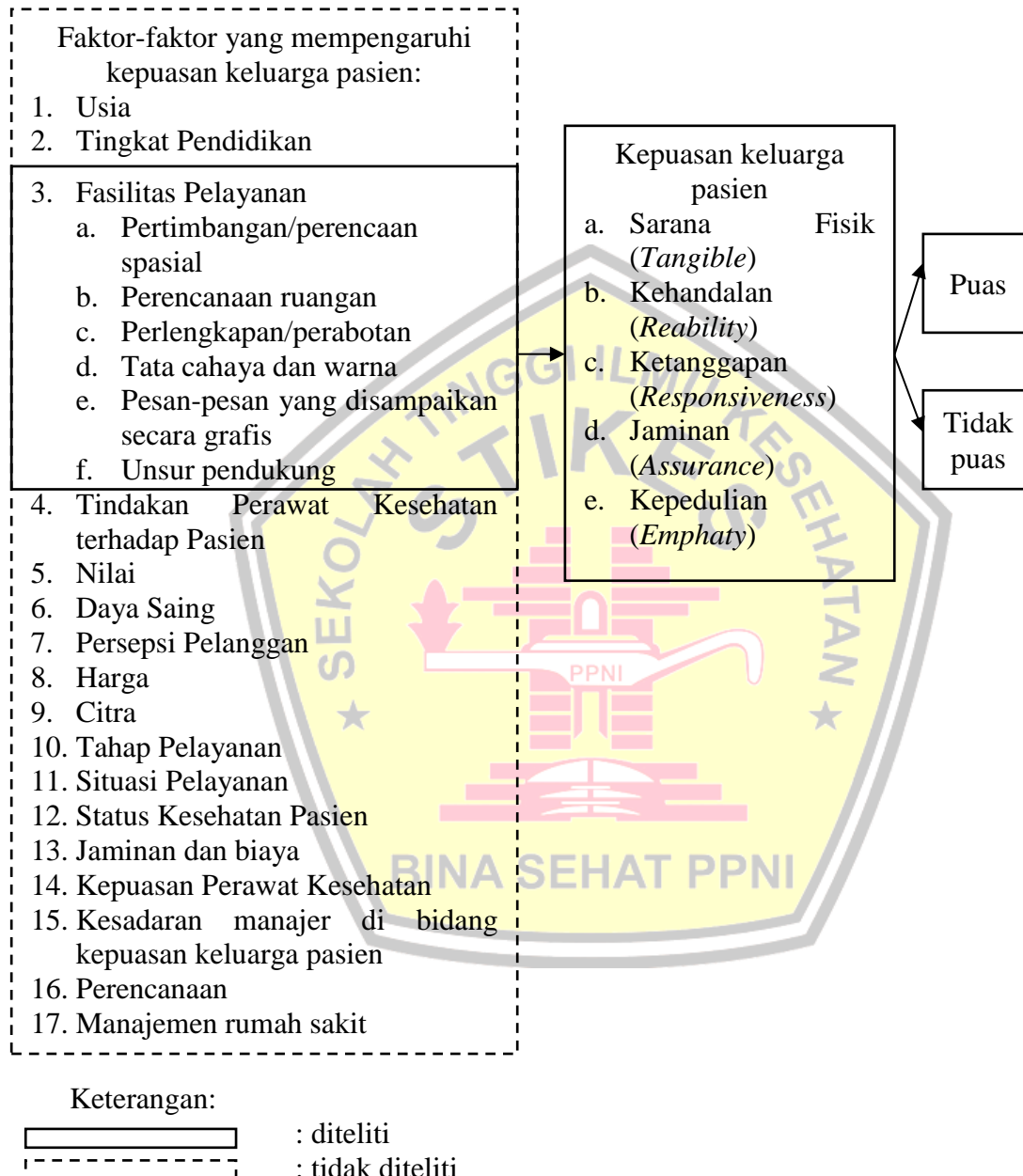
Gambar 2.3 Kerangka Konseptual Analisis Kepuasan Keluarga Pasien Berdasarkan Fasilitas Pelayanan Di Rumah Umum Anwar Medika Krian Sidoarjo Penjelasan Kerangka Konseptual:

Kerangka konsep di bawah ini didapatkan dari modifikasi teori Silalahi, Rantetampang, Msen, & Mallongi, 2019; Rangkuti, 2012; Pai, Ravi, & Chary, 2011; Farzianpour, Byravan, & Amirian, 2015)