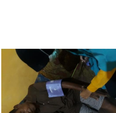
Lampiran 4 : Dokumentasi